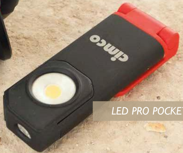
LED PRO POCKET