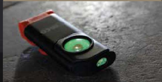
Funkce Find your light