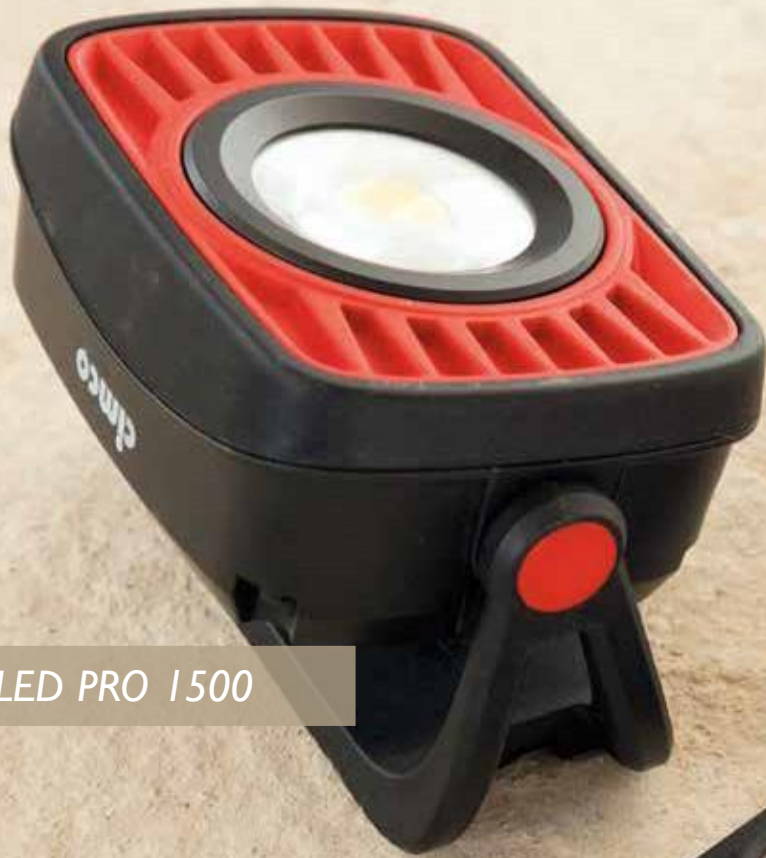
LED PRO 1500