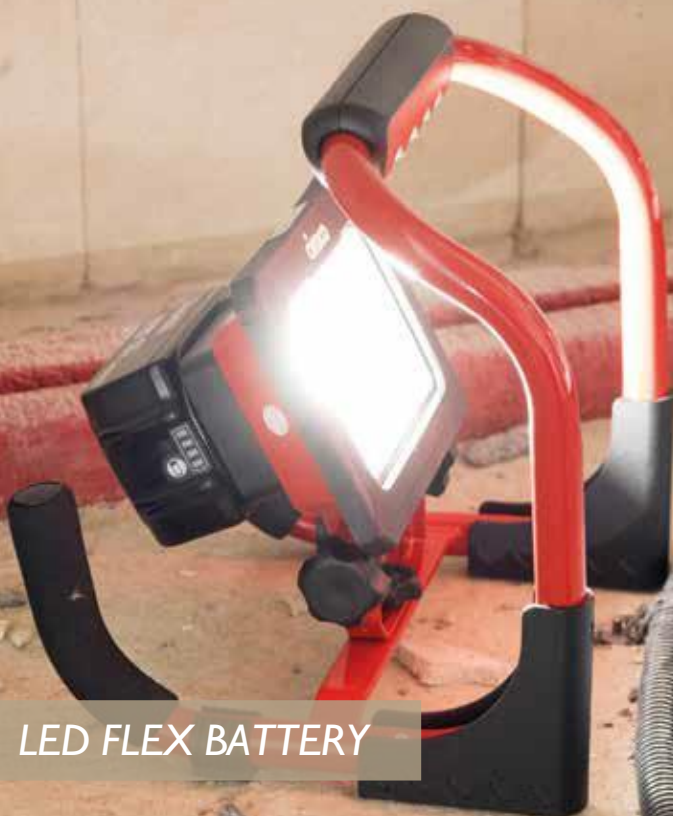
LED FLEX BATTERY